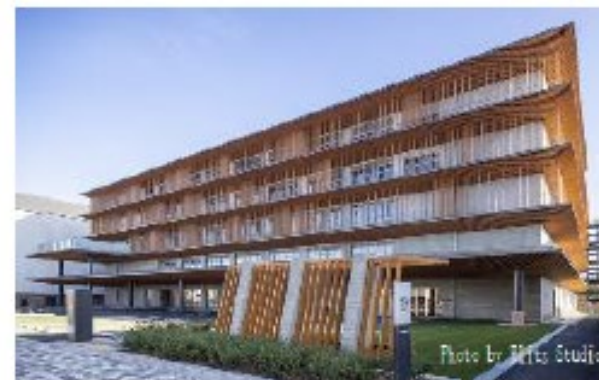
▲COCO・てらす（3施設一体化整備）