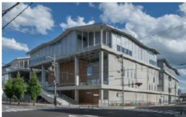
▲京都市立芸術大学新キャンパス

京都市 GB のフレームワークは、調達資金の使途、対象事業の評価・選定プロセス、調達資金の管理、レポートの 4 つで構成している。資金使途で額が最も大きいのは市有施設新築・増築事業（2023 年度：56.59 億円）。環境性能に優れた市有施設の整備事業では、京都市立芸術大学新キャンパスや西京区総合庁舎、福祉施設の COCO・てらすに充当し、市庁舎にも充てた。対象は、CASBEE（建築環境総合性能評価システム）をベースに、独自のシステムとして策定した CASBEE 京都の評価において、A ランク以上のものに限定している。